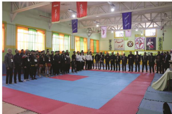
برگزاری مسابقات ووشو دانشگاه‌ها و موسسات آموزش عالی منطقه ۹ کشور و انتخابی المپیا د دانشجویان کشور در شهرستان تربت جام صفحه ۳