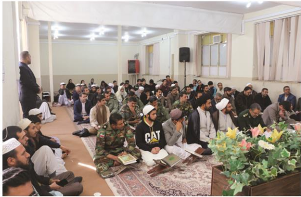
برگزاری محفل انس با قرآن کریم با حضور قاریان و حافظان استانی و کشوری در مجتمع صفحه ۸

دانشگاه و دانشجو باید همواره انقلابی باشند. مقام معظم رهبری (مدظله العالی)